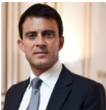
Monsieur le Premier Ministre Manuel Valls, 5 mars 2015

Le Parlement des Etudiants est soutenu depuis mars 2015 par le Premier Ministre Monsieur Manuel Valls, et compte également l'Assemblée nationale parmi ses soutiens officiels avec notamment Monsieur Claude Bartolone, Président de l'Assemblée Nationale comme parrain de l'initiative.